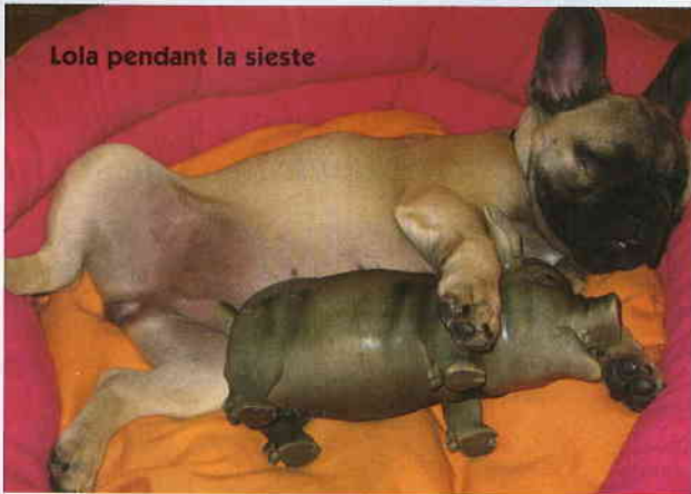
Lola pendant la sieste