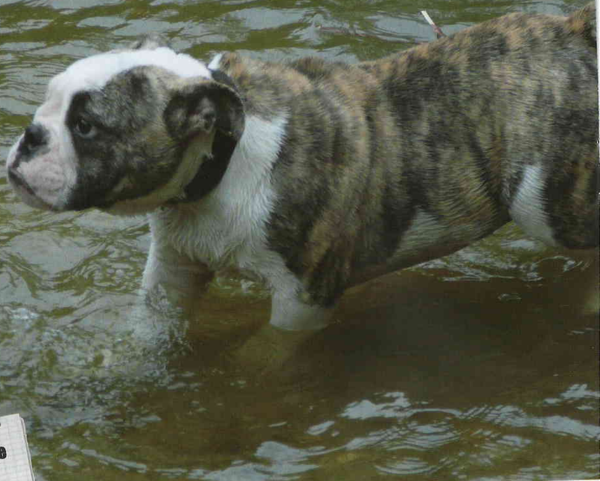
Alain prend son bain

Doggies et Compagnie Gabriela et son équipe 6, rue Hudri 92400 Courbevoie Tél. : 06 25 74 42 81 ou 01 43 34 50 80 www.doggiesetcompagnie.com doggiesetcompagnie@yahoo.fr