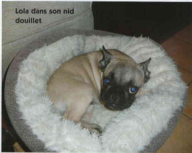
Lola dans son nid douillet