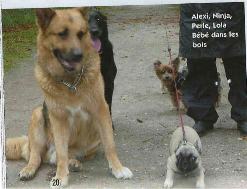
Alexi, Ninja, Perle, Lola Bébé dans les bois

G. J. : En effet, il s'agit des gardes de chiens en famille d'accueil. Nous hébergeons votre chien pendant toute la durée de vos vacances dans un cadre privilégié. Les « nounous » ainsi que leur domicile, sont sélectionnés en fonction des besoins de votre animal. Vous pouvez ren-